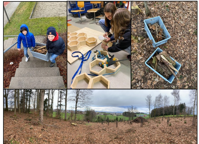
Fabian Fischer, Unterrichtsassistenz

In weiteren Schritten werden die Lernpartner/innen bis zur Fertigstellung des Wildbienenhotels viele wichtige und interessante Dinge über die Natur und über sich selbst erfahren.